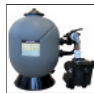
S0246S16XX Groupe Filtration Sand Filter Systems